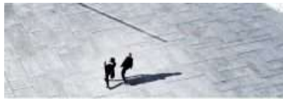
Études de cas COVID-19 COVID-19 Case Studies Réponses du secteur philanthropique canadien Responses from Canada's philanthropic sector